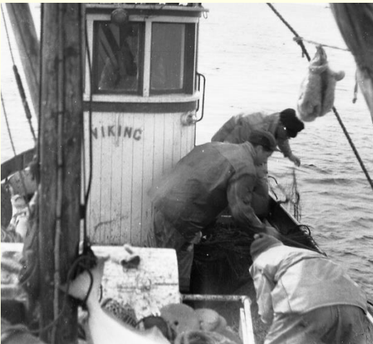
«Viking» sildefiske 1950 åra