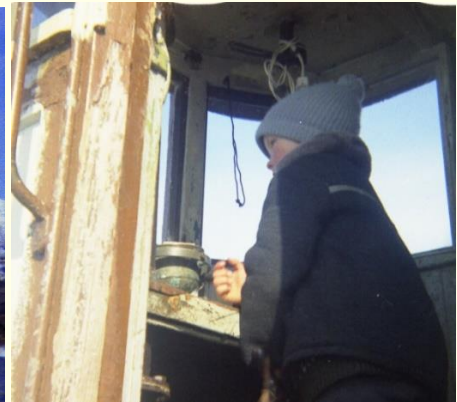
Forsyninger og mannskap Storholmen - 1965