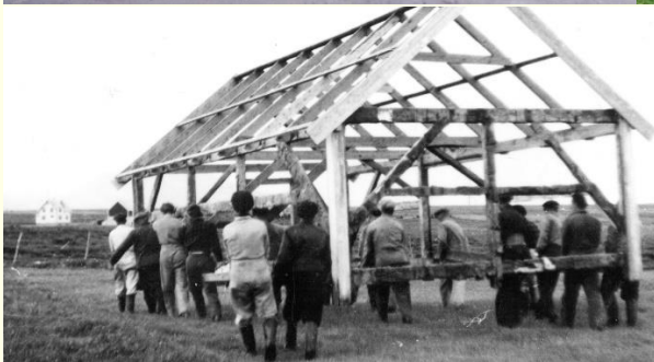
Gjenbruk: Einar flytter sommerfjøset fra Vikegarden som blir til garasje når han bygger nytt hus i 1956. Garasja står fortsatt i Blindheimsvika.