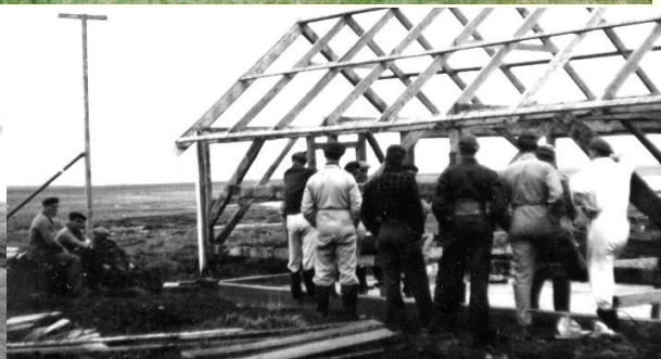
Garasja på plass i Blindheimsvika Dugnads gjengen kan puste ut!